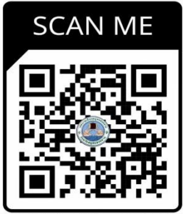
แบบคำร้อง (เสียงตามสาย) เทศบาลเมืองสมุทรสงคราม